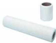
■ wedi Tools, Armierband, selbstklebend

i Weitere Produktinformationen und alle Artikeldaten finden Sie in der aktuellen wedi Preisliste sowie unter www.wedi.eu