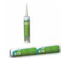
■ wedi 610, Kleb- und Dichtstoff