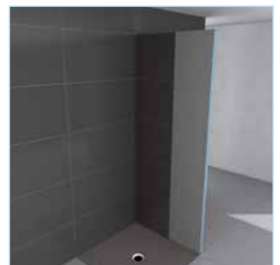
... fliesen, fertig!