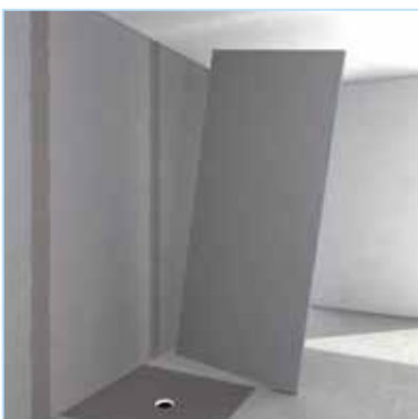
Einfach aufstellen ...